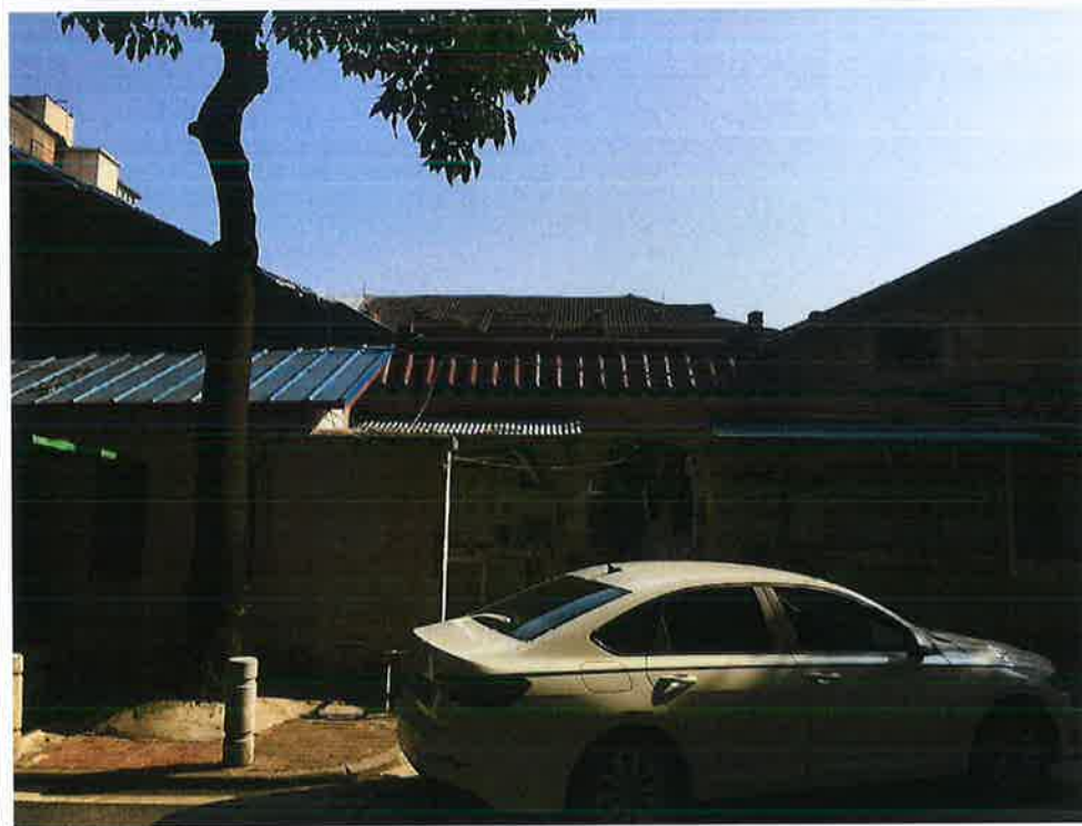
图4 沙园五街南2、3巷平房周边环境