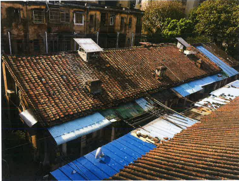
图3 沙园五街南2、3巷平房