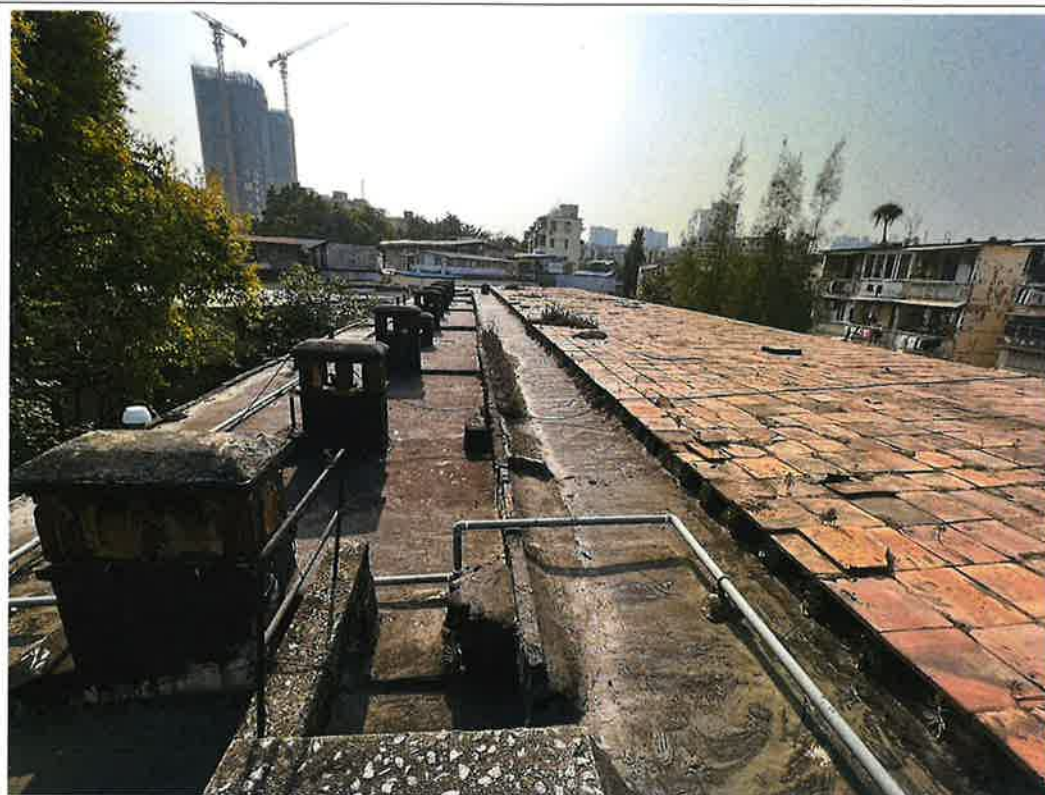
图1 沙园村尾14栋天面